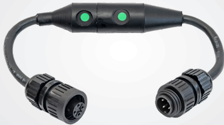
Steckverbinder mit Notzugentriegelung